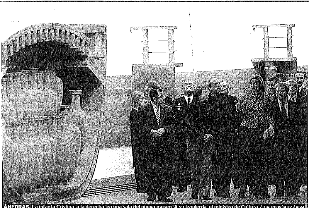
ANFORAS. La infanta Cristina, a la derecha, en una sala del nuevo museo. A su izquierda, el ministro de Cultura.