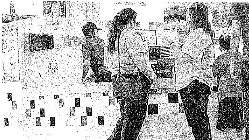
Dos mujeres con problemas de sobrepeso esperan a ser atendidas en una heladería.

► Alhama y Pilego. Son los municipios con más personas obesas, con un 50 por ciento de la población. Le siguen Cehegín y Beniél con el 11 por ciento, Yecla, 4 por ciento y San Pedro del Pinatar, 0,5 por ciento. En cuanto a sobrepeso, Los Alcázares llega al 80 por ciento, Beniél 66 por ciento, Bullas 62,5 y Mazarrón y Fuente Álamo con el 54,4 por ciento.